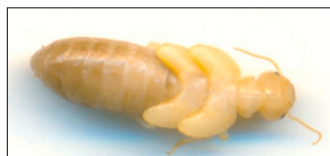
Рис. 2. Нимфа с зачатками крыльев Примечание: составлен авторами по результатам данного исследования

Кроме того, в ходе исследований в сентябре на этих стационарных участках в первом термитнике была обнаружена одна нимфа с ярко выраженными зачатками крыльев (рис. 2).