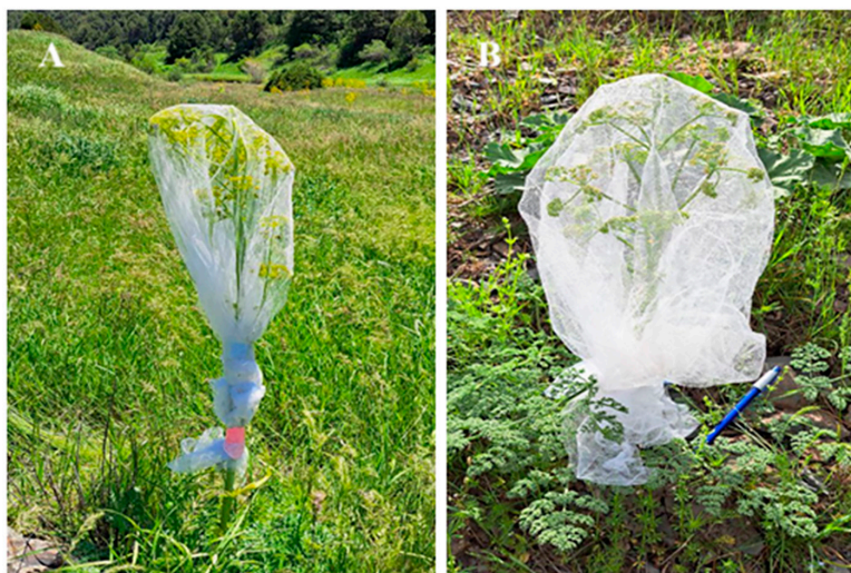
Рис. 1. Растения, изолированные от насекомых сеткой (А – Ferula samarkandica , В – Ferula dshizakensis ) (Зоминский государственный заповедник)

Статистическая обработка данных проводилась с использованием пакета Statistica 10.0. Все значения представлены в виде среднего значения \pm стандартная ошибка среднего (Mean \pm SE). Для сравнения экспериментальной и контрольной групп применялся двусторонний t-тест Стьюдента для независимых выборок. Различия считались статистически значимыми при p < 0,05 .