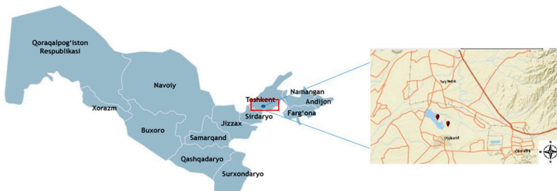
Рис. 1. Координаты территории проведения исследования Примечание: составлен авторами по результатам данного исследования

Плотина состоит из насыпного земляного вала, с левым и правым откосами, водосливом и водосбросом. Длина плотины – 2,4 км, береговые откосы сложены песчано-грунтовыми материалами. Водоем гидрологически связан с дамбой длиной 1,9 км. Через плотину проходит автомобильная дорога Ташкент – Бекабад. Из водохранилища подается вода в р. Карасув и в левый береговой канал Туябугуза. Туябугузское водохранилище обеспечивает улучшение водоснабжения орошаемых земель в Бекинском, Оккургонском, Средне-Чирчикском и Нижне-Чирчикском районах Ташкентской области. В водоеме разводят различную рыбу (рис. 1) [5, с. 104–109].